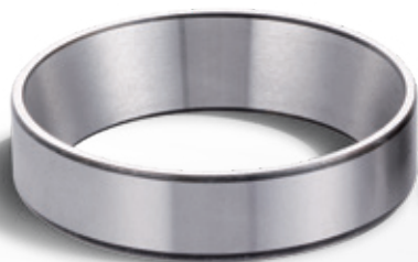
Матовая поверхность дорожки качения

«Мы гордимся своим опытом в области суперфинишной обработки и являемся поставщиками запчастей для более чем 400 суперфинишных станков. Чтобы оценить качество обработки, взгляните на эти изображения. На фотографии справа отчётливо виден зеркальный эффект - так выглядит обработанная поверхность. При собранном подшипнике обработка не заметна, но от этого она не становится менее значимой. Обратите внимание на то, что менее технологичная продукция снаружи может выглядеть идентично...»